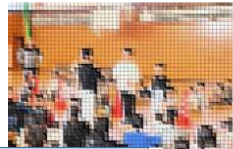
3・4年生の様子 立ち幅跳び、重さ量りクイズ、アイヌの人々の暮らしや文化など発表内容は多岐にわたりました