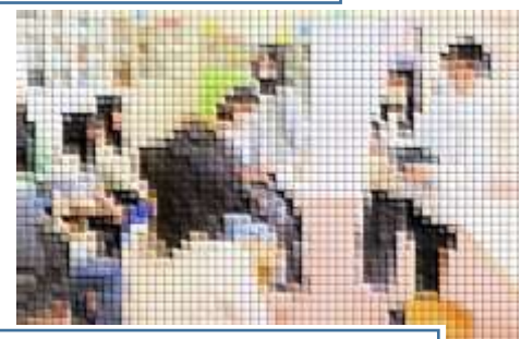
5・6年生の様子 十勝の〇〇などと題して調べたことを発表したり、修学旅行のまとめを壁新聞をつかってわかりやすく発表したりしていました

子どもたちは、一年間の学びの中から深掘りしたものを、他学年にわかりやすく伝え合うなど主体的に学び合っていました。子どもたち自身が目を輝かせながら、この活動を通して、知をデザイン化しながらアウトプットする力を高めていました。